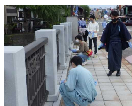
【昨年の浅野川大橋 清掃活動の様子】